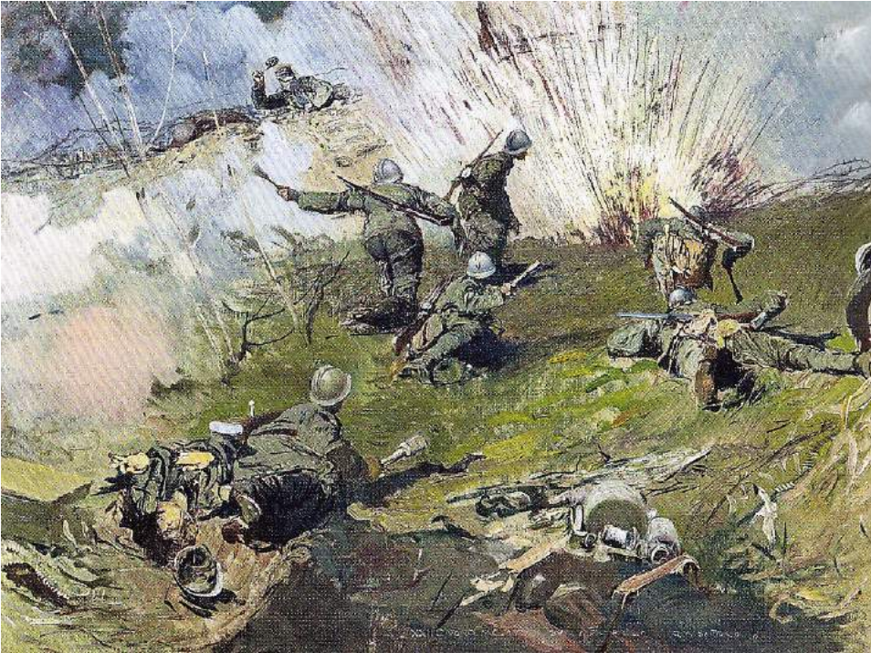
Giulio Aristide Santorio. Sul Montello. 1918