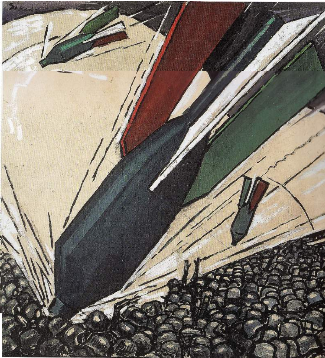
Mario Sironi. Bombardamento. 1918