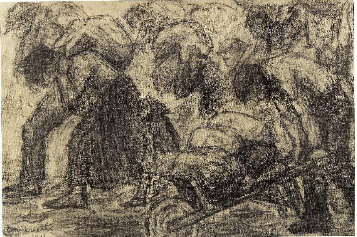
Giuseppe Cominetti. Profughi. 1917