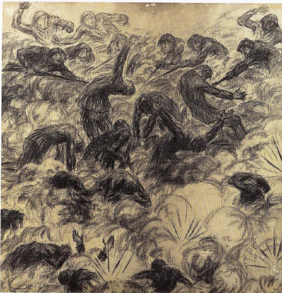
Giuseppe Cominetti. Assalto alla baionetta. 1916