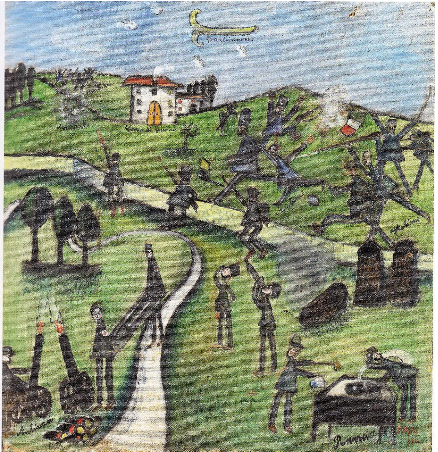
Ottone Rosai. Guerra + rancio (Fronte). 1916