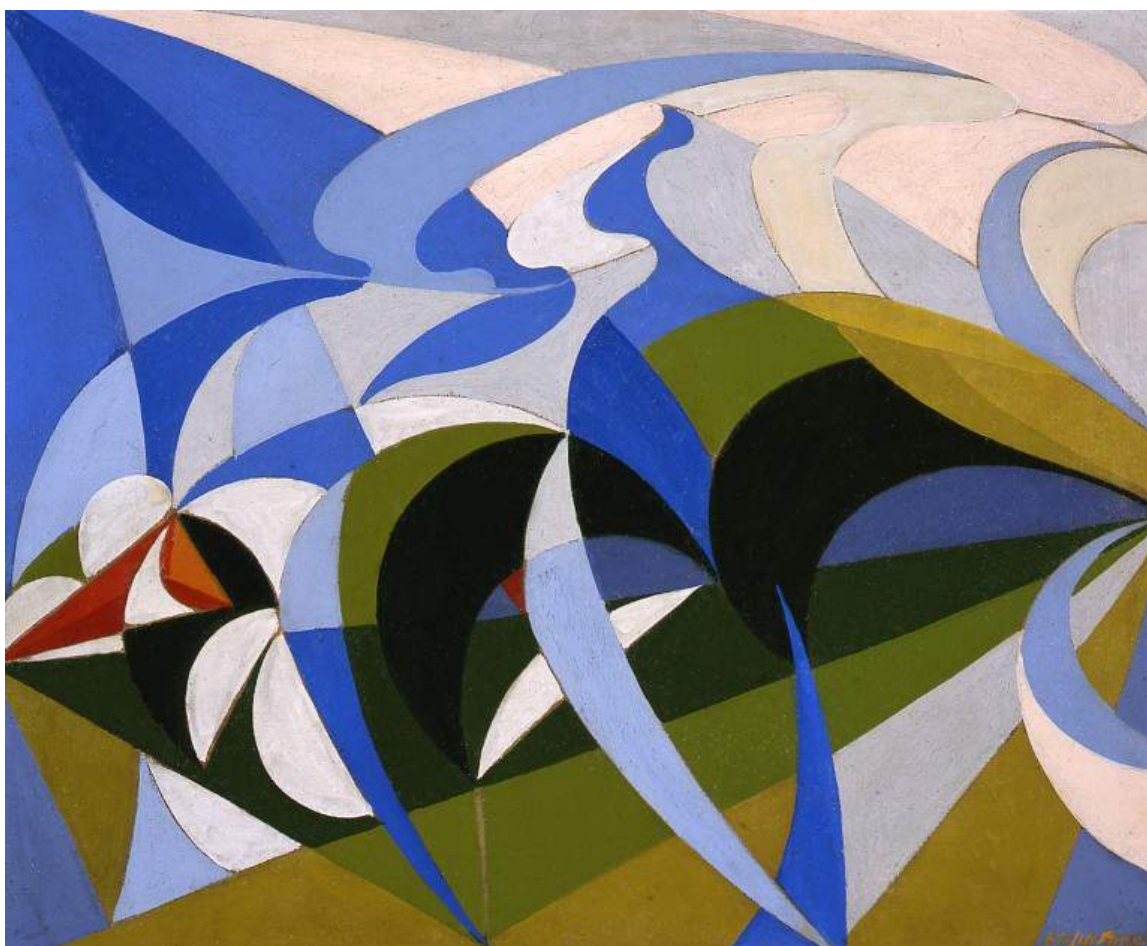
Giacomo Balla. Colpo di fucile domenicale. 1918