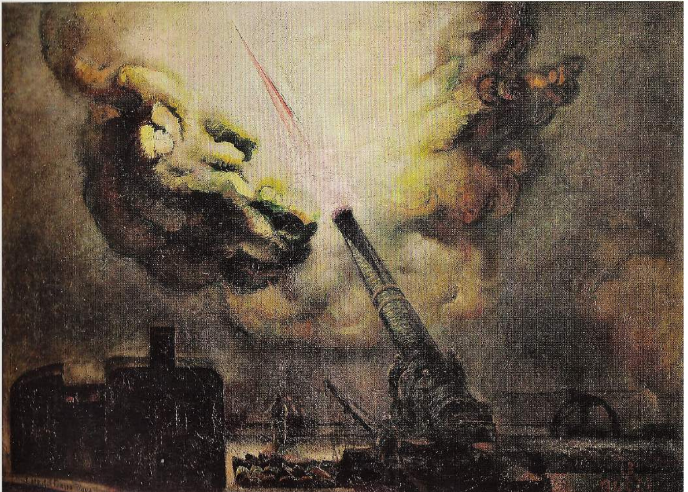
Anselmo Bucci. Fuoco! 1918