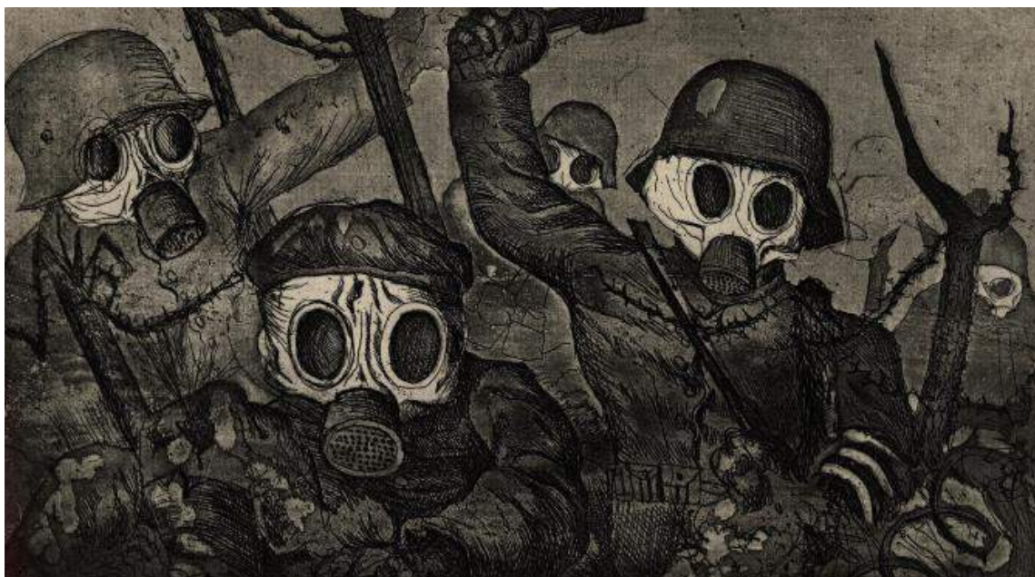
Otto Dix, dalla serie Der Krieg (la guerra)