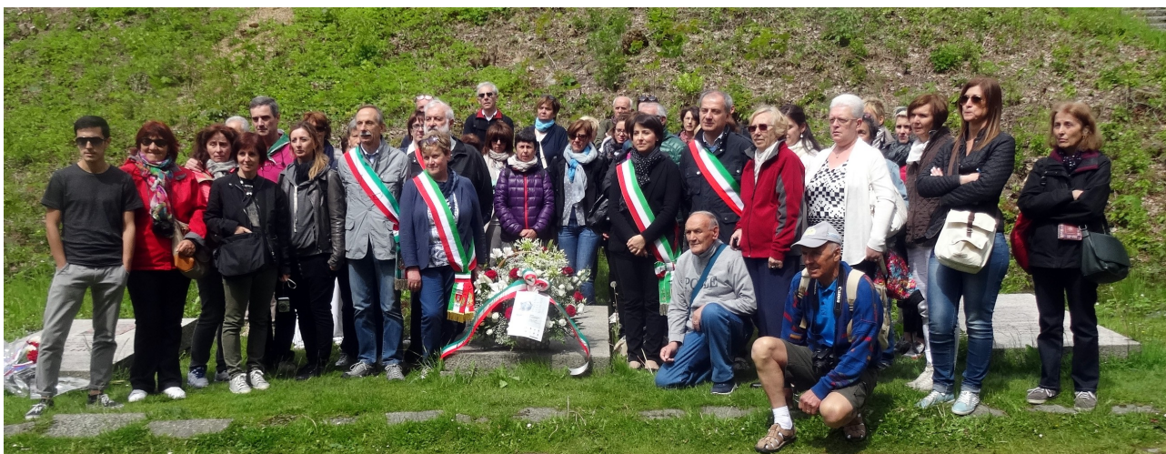
Hersbruck, sottocampo del Lager di Flossenbürg Nel Rosengarten si trova dal 2007, la scultura Ohne Namen di Vittore Bocchetta