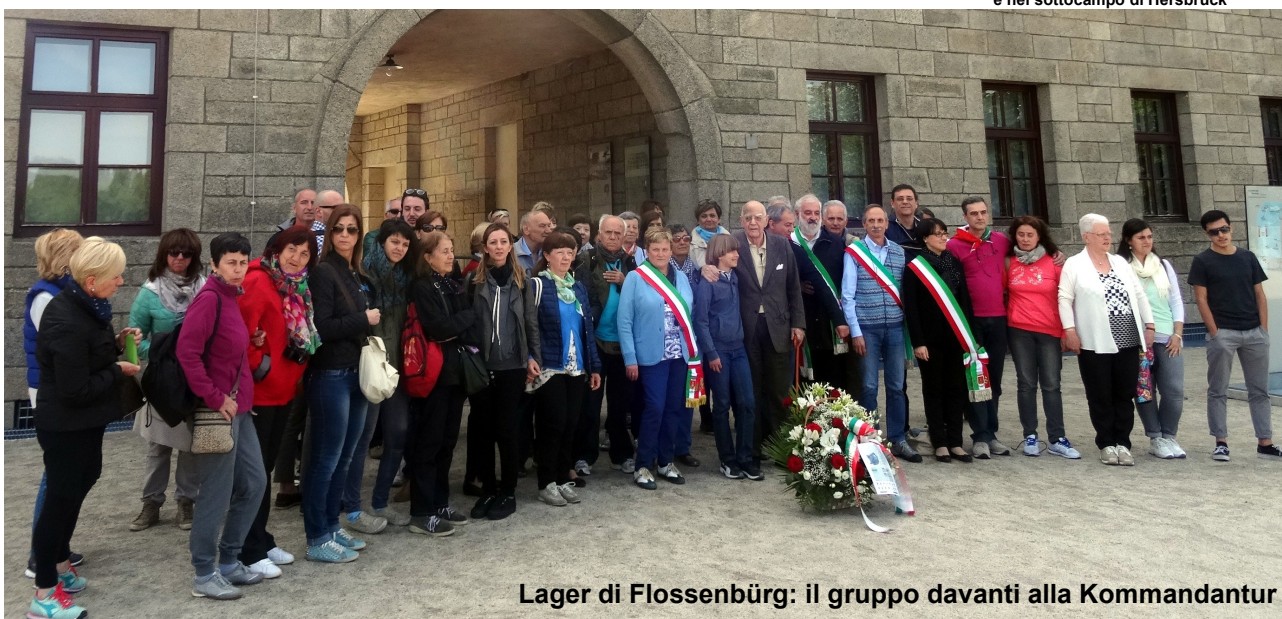
Lager di Flossenbürg: il gruppo davanti alla Kommandantur