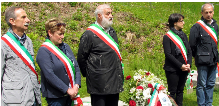
Lager di Flossenbürg: momento commemorativo nella piazza delle nazioni