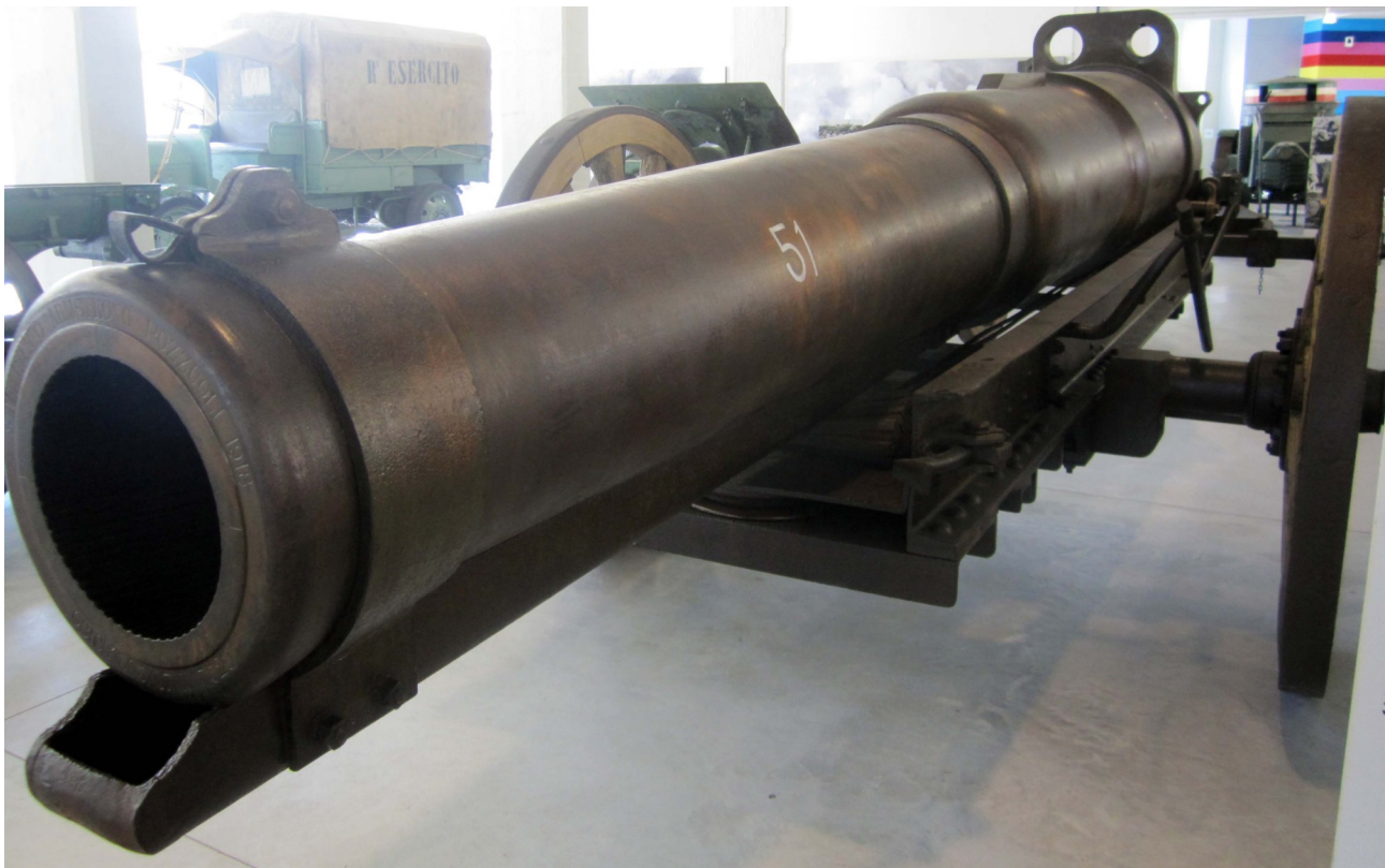
sett. 2014